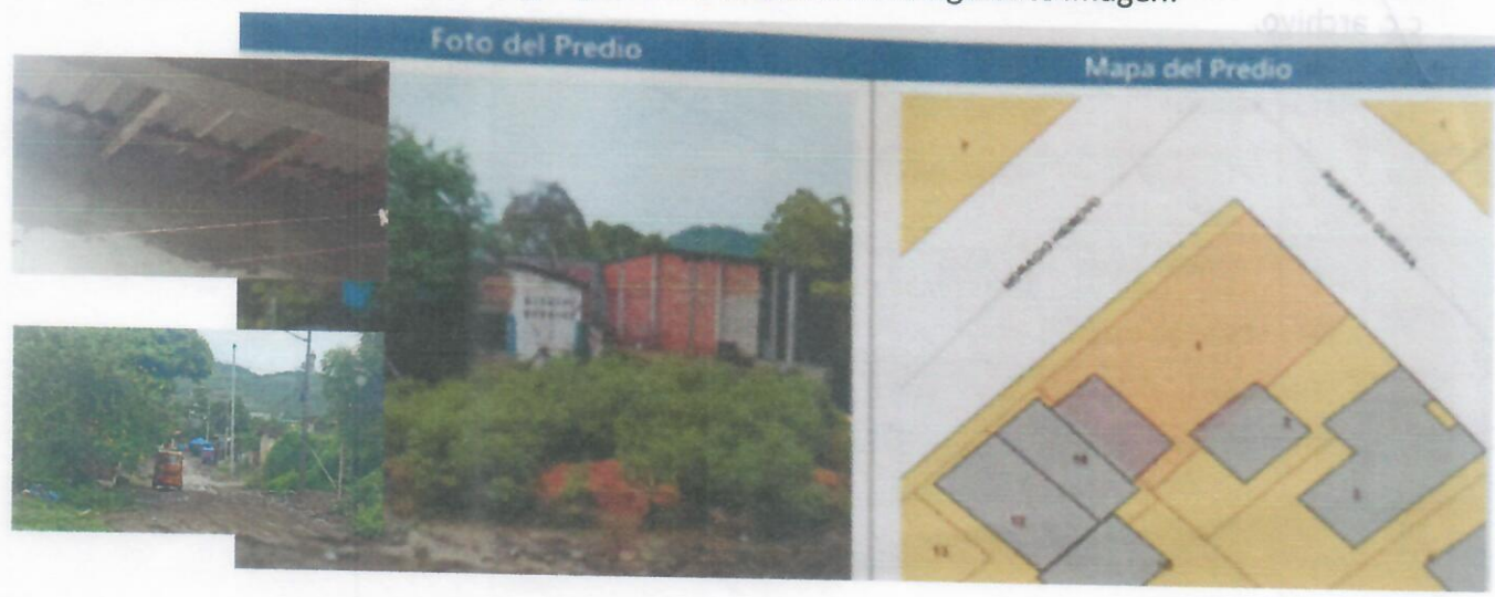
CROQUIS DE UBICACIÓN E IMAGEN DE LA VIVIENDA SOBRE EL TERRENO

El solar se ubica en la Cdla. Luis Gencon, calle Pompeyo Guerra y C. Horacio Hidrovo de la parroquia Puerto López cuya ubicación geográfica se muestra en la siguiente imagen: